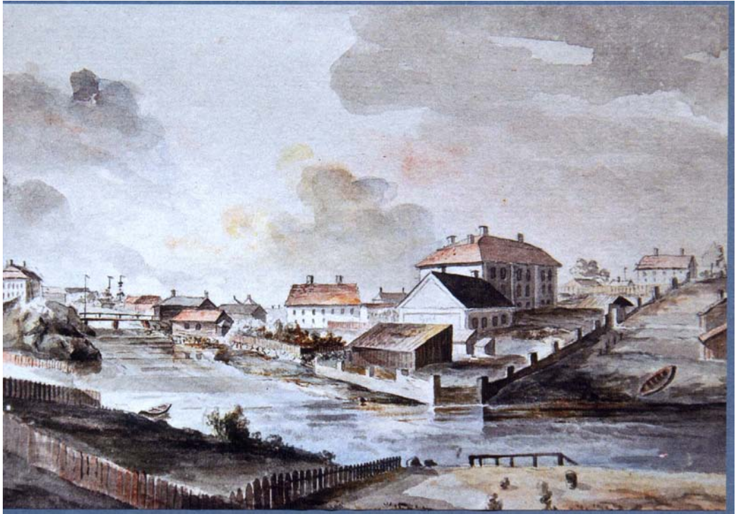
Akvarell av J.C. Linnerhielm 1787. Akvarellen visar hur viktigt utblickarna från Gävle Slott var för dess skapare och hur centralt byggnaden var i stadens historia.